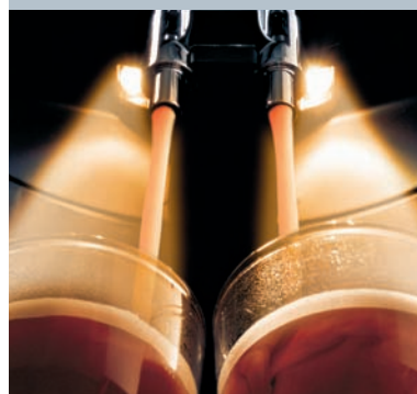
Spiel für die Sinne